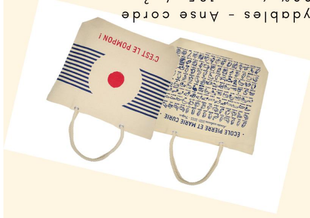
LE SAC MARIN

Matières: 50% coton-50% polyester 275g/m 2 - Dimensions: L.150xH.80 cm